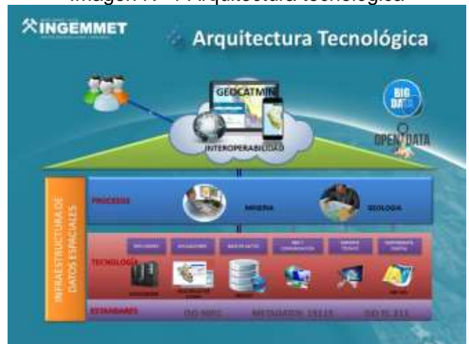
Imagen N° 1 Arquitectura tecnológica