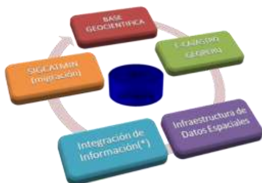
Imagen N° 4 Geodatabase integrada

La gestión de datos se realiza usando la tecnología de ESRI - Geodatabase corporativa.