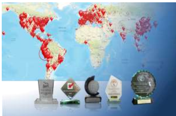
Imagen N° 5 Reconocimientos y visitas