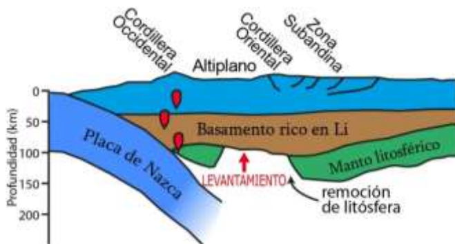
Figura 2. Representación esquemática del altiplano andino

cerrados, lo cual facilita la concentración de elementos litófilos como el Li en las facies de intracaldera (Benson et al., 2017), en añadidura el aporte de Li por aguas subterráneas también es posible (Munk et al., 2016), después de la formación de las calderas estas se encuentran sujetas a levantamiento o subsidencia acorde al marco tectónico (Rytuba, 1994). En consecuencia se enfatiza la localización de las estructuras tipo caldera tales como fallas anulares y radiales, las cuales posiblemente han sido obliteradas por erupciones volcánicas continuas y/o por diversos procesos erosivos.